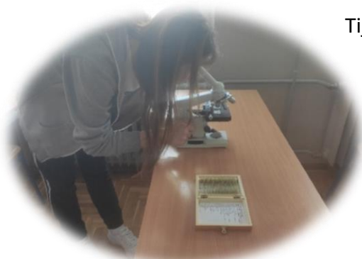
Slika 3. Mikroskopiranje trajnih preparata

Tijekom projekta proučili smo brojne teme vezane za mikroskop i mikroskopiranje te smo naravno mikroskopirali svježe izrađene, ali i trajne preparate dijelova tijela biljaka, životinja i čovjeka i pri tome se odlično zabavili!