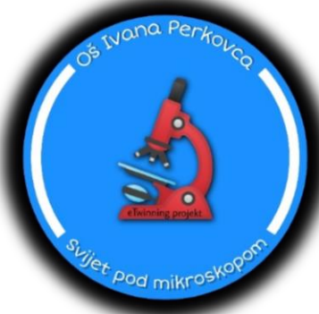
Slika 2. Logo projekta škole (Autor: Luka Munić)

Logo projekta naše škole osmislio je učenik 7.b razreda Luka Munić.